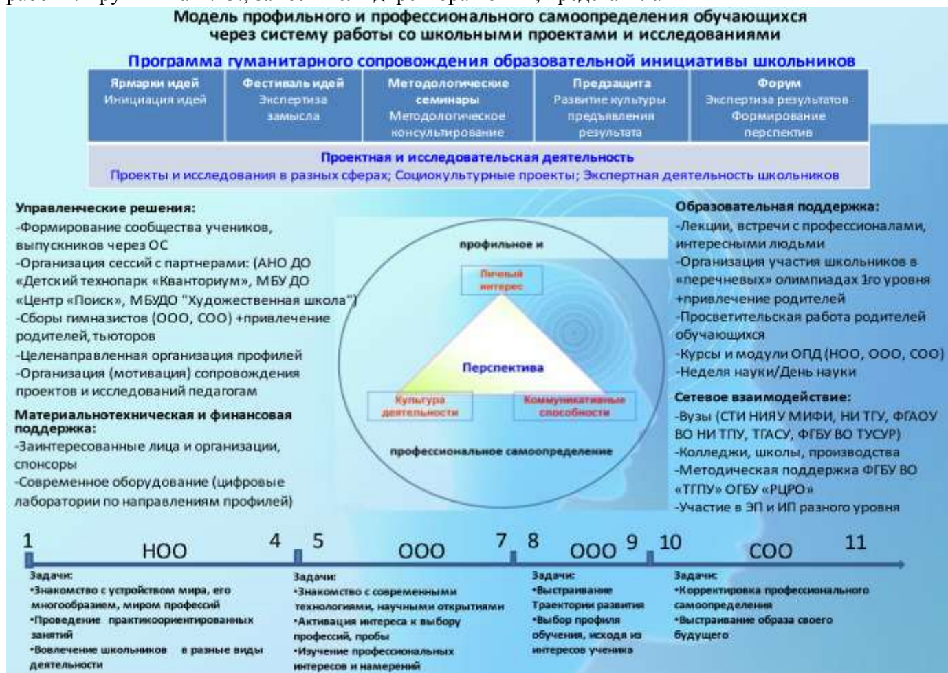
Дорожная карта по теме экспериментальной площадки ТГПУ